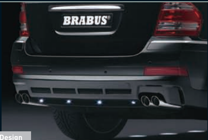
On Road Design