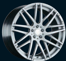
Platinum Edition Monoblock F Kreuz-Speichendesign geschmiedet, „brushed finish“