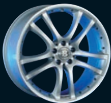
Monoblock S Doppel-Speichendesign, silber ganz poliert