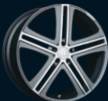
Platinum Edition Monoblock G Doppel-Speichendesign geschmiedet, anthrazit „Titan“ matt mit hochglanzpolierter Oberfläche