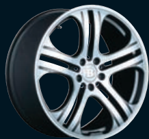
Monoblock Q Doppel-Speichendesign anthrazit „Titan“ ganz poliert